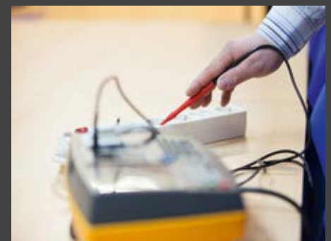
PRÜFUNGEN NACH BetrSichV